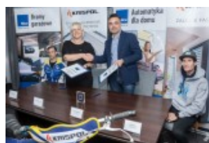
Krispol i Nice sponsorami zawodów żużlowych