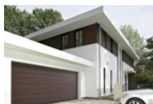
Duragrain - nowe wzory bram garażowych