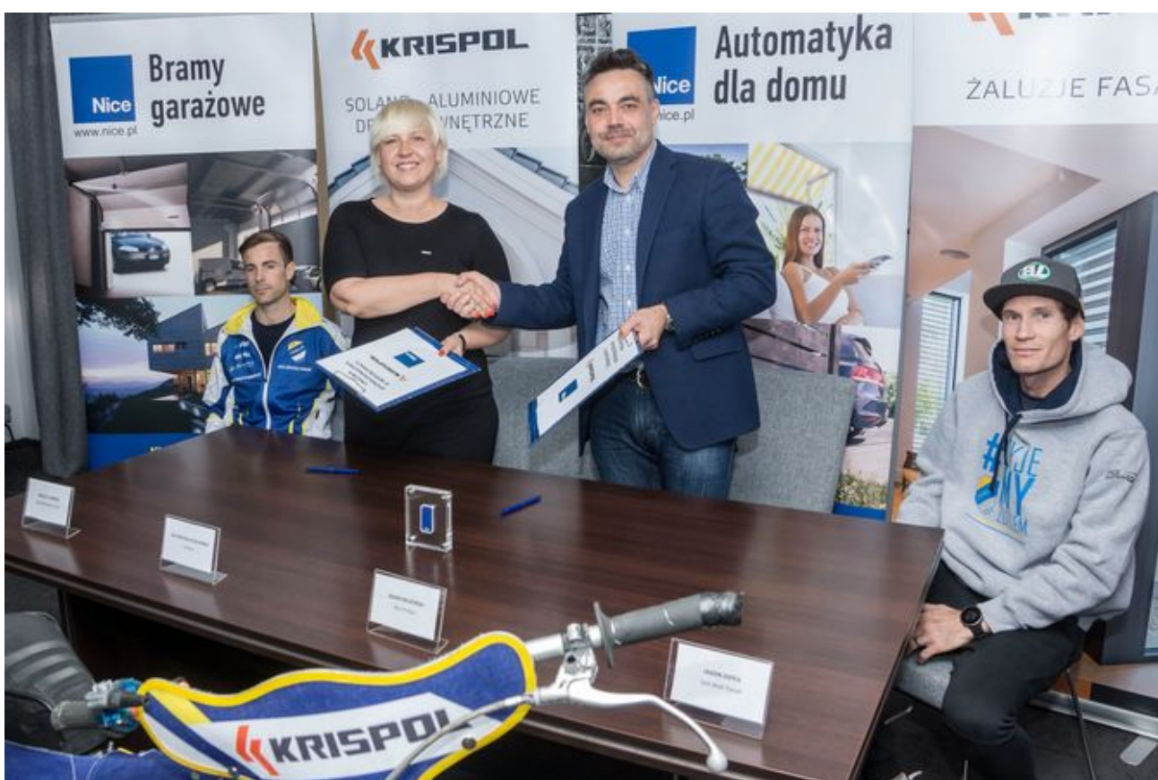
Krispol i Nice sponsorami zawodów żużlowych