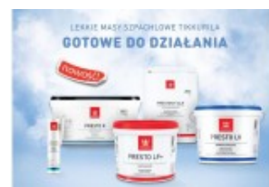
Tikkurila wprowadza nową linię mas szpachlowych