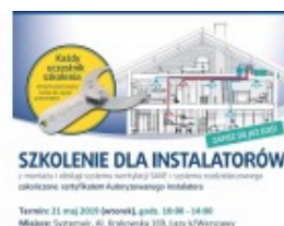
Bezpłatne szkolenia dla instalatorów